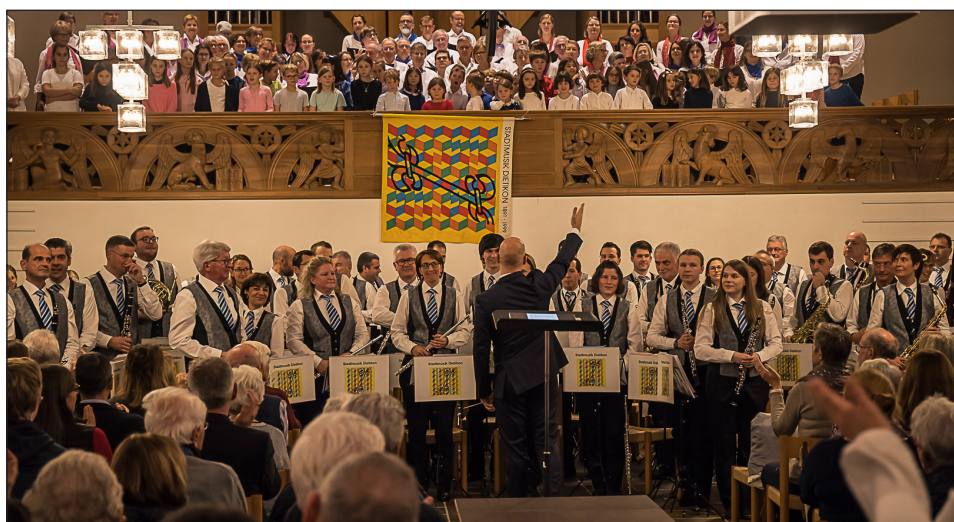
Über den grossen Applaus am Ende des Konzerts freuten sich Musikanten und Sänger.