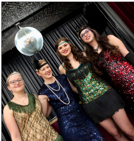
Die Ladies des OK-Teams.

Mit Spitzen, Pailletten und Fransen machten diese dem Stil der 20er Jahre alle Ehre.