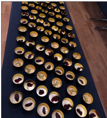
Die kleinen Leckereien vom Dessert-Buffer.

Für unser kulinarisches Wohl sorgte das Catering Linde aus Weiningen und verwöhnte uns mit leckerem Nüssli-Salat und traditionellen Linde-Spätzle mit Stroganoff. Ein auswahlreiches Dessertbuffet spendierten die diesjährigen Veteranen - vielen Dank!