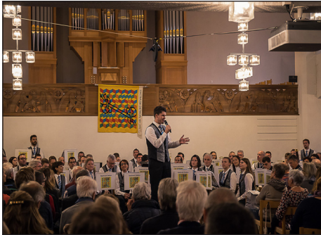
Der Präsident begrüßte die Zuhörer.

Schon in früheren Konzerten blitzte dieser Plan punktuell auf. Die Musikanten der Stadtmusik Dietikon legten damals jeweils ihre Instrumente beiseite und setzten alternativ ihre Stimmbänder ein. Mit einem Elvis Presley-Song debütierte die Stadtmusik als Chor. Jahre später wagten wir es erneut mit einem Song von Leonard Cohen («Hallelujah»).