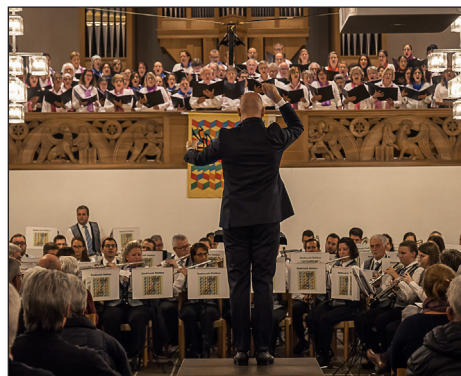
Gemeinsames Musizieren im Stück «After the Storm».

«After the Storm» des Amerikaners Stephen Melillo ist eine rund 10-minütige Komposition, bei der mit einem grossen Chor eine neue Klangfarbe in die Musik einfließen soll. Das moderne und (für Chor und Orchester) äusserst anspruchsvolle Werk vermochte unsere Zuhörer denn auch zu überzeugen. Fortsetzung auf Seite 9