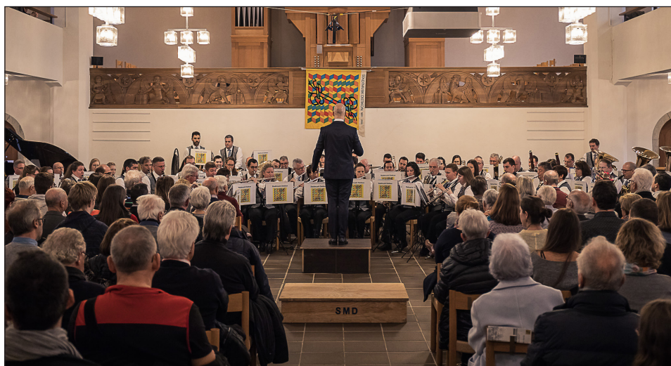
Die Stadtmusik Dietikon präsentierte drei Werke für Bläserorchester.